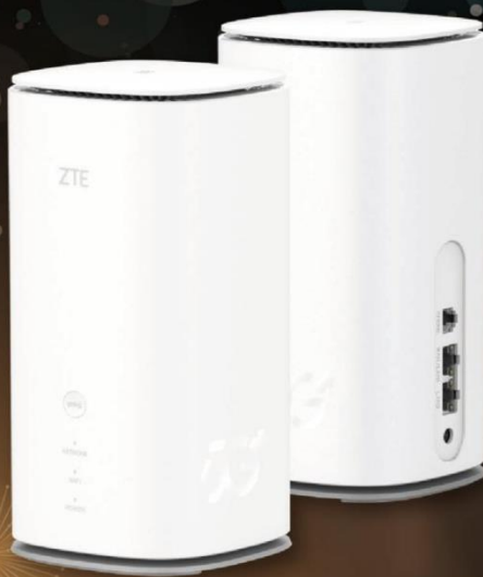
ZTE MC8020 5G INDOOR CPE (B03)