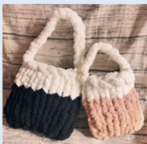
Approximate: 27 cm (W) x 24 cm (H)